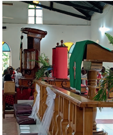
Konkret auf einer Kirchenkanzel in Tansania erfahrbar – die Zugehörigkeit des Christentums zum Glauben Israels.

gemeint ist Elischa, heilen lassen. Die hochangesehenen Leute verstehen alles falsch, und so schreibt der König von Aram einen