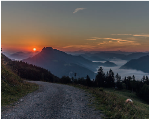
Suchthilfe – mit Gott einen neuen Weg beginnen